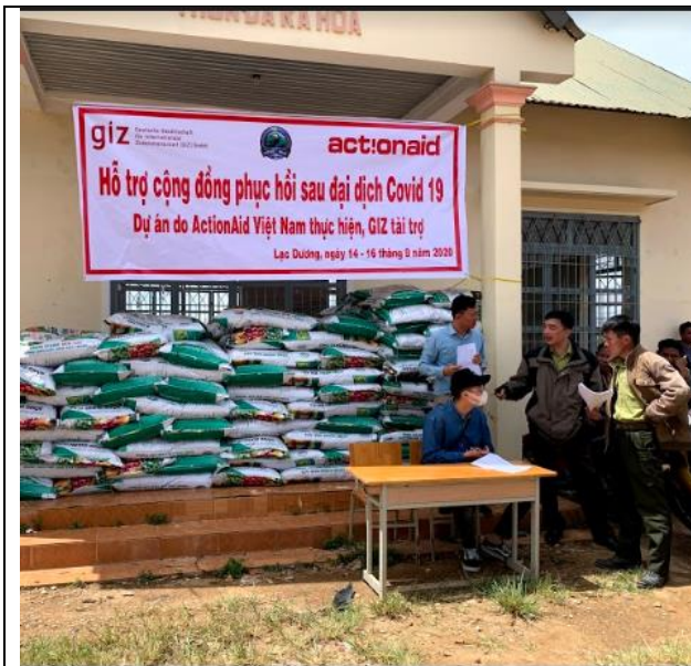
Hạt giống và phân bón sẵn sàng cung cấp cho nông dân địa phương (xã Đa Nhim, huyện Lạc Dương)