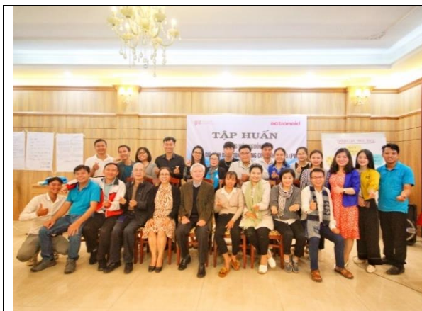
Các học viên tham gia khóa đào tạo đã gặp gỡ và giao lưu với đoàn AAV/ AFV (thành phố Đà Lạt)