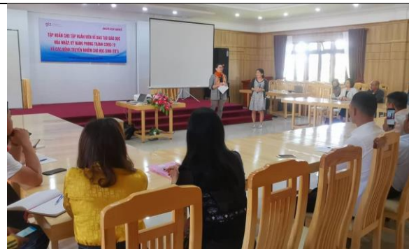
Khai trương chào đón nhà tài trợ trong khóa đào tạo TOT (thành phố Đà Lạt)