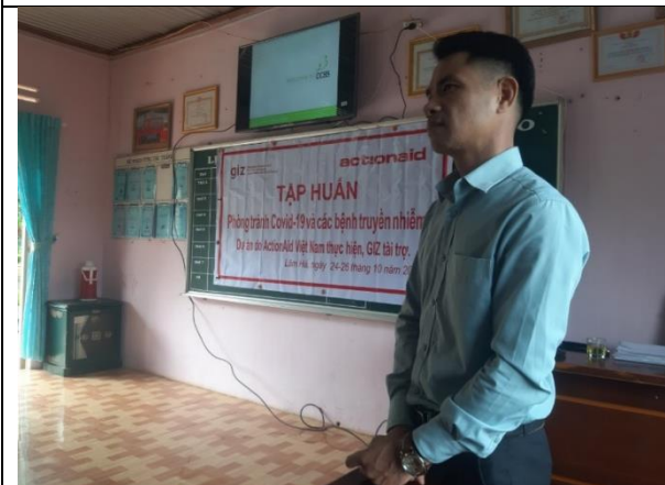
Một học viên tốt tạo điều kiện cho một khóa đào tạo triển khai tại trường THCS Tân Thành 1 (huyện Lâm Hà)