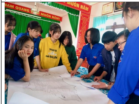
Đi thực địa đến xã Tân Thanh và thực hành sử dụng dụng cụ PVA với một nhóm thanh niên địa phương (huyện Lâm Hà)