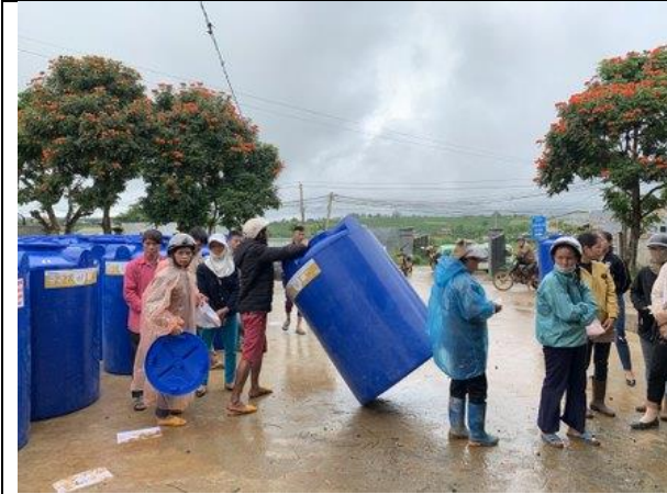
Các hộ dân địa phương đang chờ nhận bể chứa nước mới (xã Tân Thanh, huyện Lâm Hà)