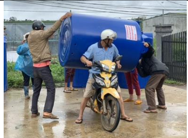
Một người dân địa phương chở bình nước mới nhận về nhà (xã Tân Thanh, huyện Lâm Hà).