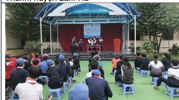
Sự kiện truyền thông tại trường tiểu học và trung học cơ sở Đa Nhim, huyện Lạc Dương