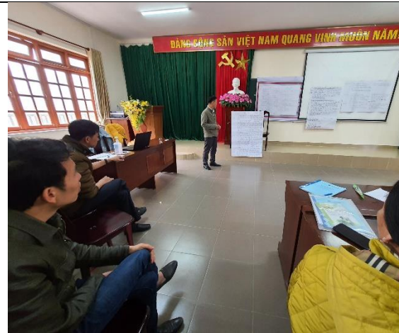
Khóa đào tạo triển khai tại huyện Lạc Dương