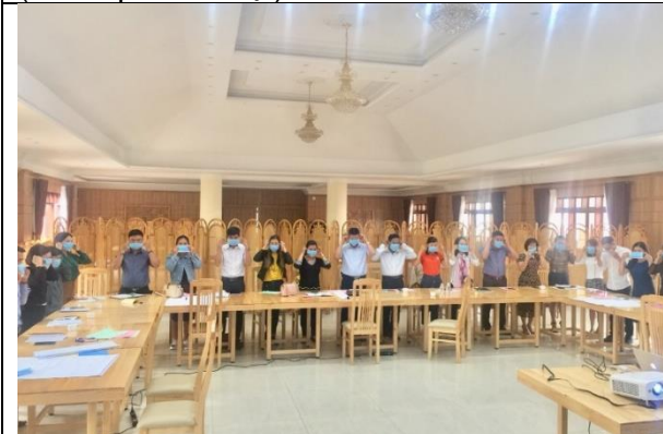
Những người tham gia tìm hiểu về Covid-19 và các cơ chế lây truyền bệnh truyền nhiễm phổ biến khác và thực hành về cách phòng ngừa ((thành phố Đà Lạt)