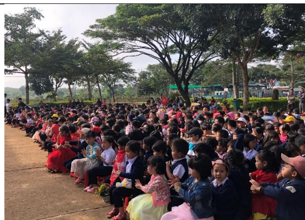
Sự kiện truyền thông tại trường tiểu học Tân Thành, huyện Lâm Hà