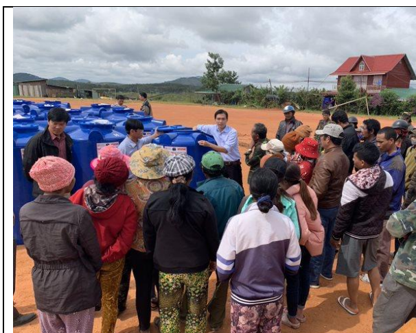
Người dân địa phương được đơn vị cung cấp hướng dẫn cách sử dụng bể chứa nước trong hộ gia đình (xã Đa Nhim, huyện Lạc Dương)