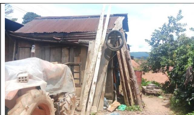
Thăm một hộ dân ở xã Đa Nhim, huyện Lạc Dương để kiểm tra người thụ hưởng