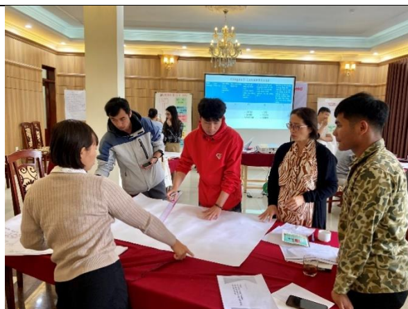
Người tham gia thực hành các công cụ PVA để thu thập và phân tích thông tin (thành phố Đà Lạt)