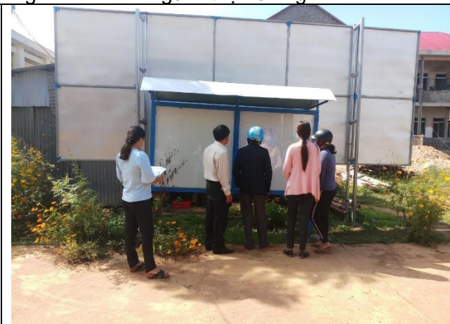
Danh sách người thụ hưởng được đăng tải trên bảng thông tin, thôn Tân Lập, xã Đan Phượng, huyện Lâm Hà