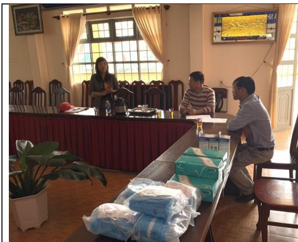
Cán bộ dự án AAV và nhân viên Vườn Quốc gia bàn giao vật tư, thiết bị y tế cho trường tiểu học và trung học cơ sở Long Lãnh (huyện Lạc Dương)