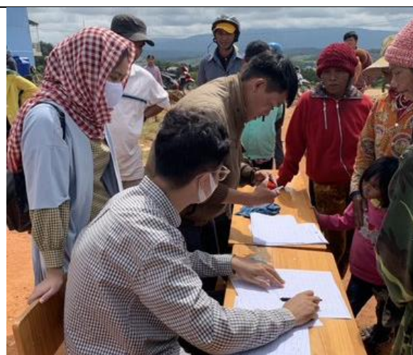
Người dân địa phương ký tên vào danh sách người tiếp nhận bể chứa nước (xã Đa Nhim, huyện Lạc Dương)