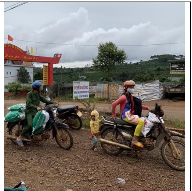
Gia đình mang túi phân bón về nhà (xã Dân Phướng, huyện Lâm Hà)