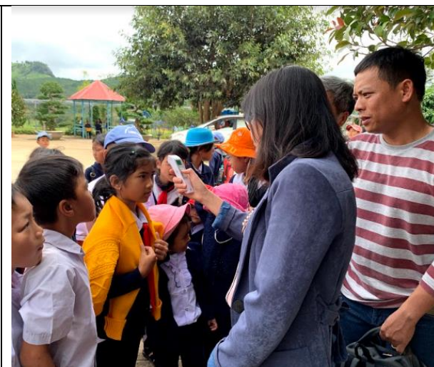
Nhân viên vườn quốc gia hướng dẫn giáo viên cách sử dụng nhiệt kế điện tử (huyện Lạc Dương)