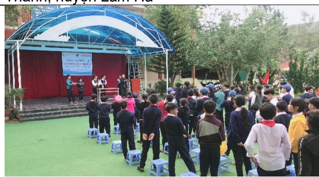
Sự kiện truyền thông tại trường tiểu học và trung học cơ sở Đa Nhim, huyện Lạc Dương