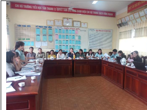
Triển khai khóa đào tạo tại huyện Lâm Hà