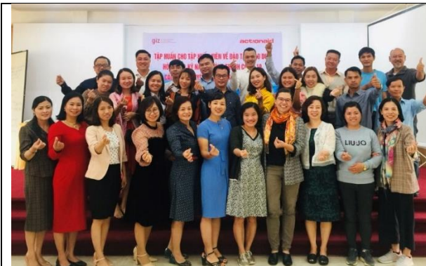
Kỉ niệm buổi tái định hình cho người tham gia và giảng viên trong khóa đào tạo TOT (thành phố Đà Lạt)