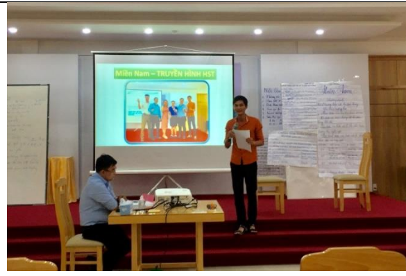
Một người tham gia trình bày kế hoạch liên lạc của nhóm mình trong trường hợp khẩn cấp (thành phố Đà Lạt)