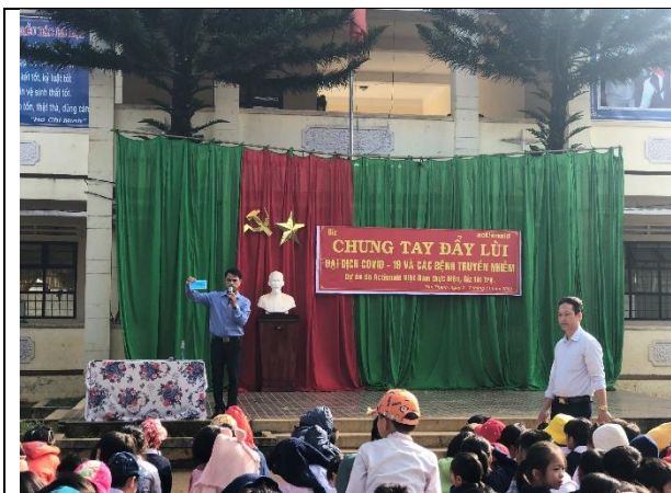
Sự kiện truyền thông tại trường tiểu học Tân Thành, huyện Lâm Hà