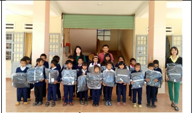
Học sinh trường tiểu học và THCS Long Lãnh nhận hồ sơ học tập mới do dự án (huyện Lạc Dương) cung cấp