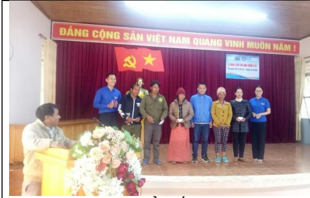
Hộ nghèo, dân tộc thiểu số nhận thẻ BHYT (huyện Lạc Dương)