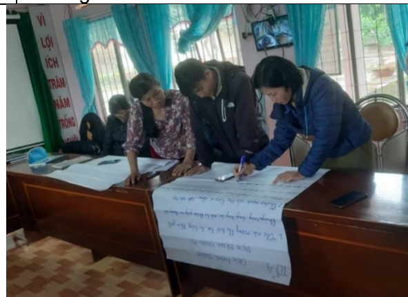
Giáo viên địa phương tham gia tập huấn tại trường THCS Tân Thành 1 (huyện Lâm Hà)