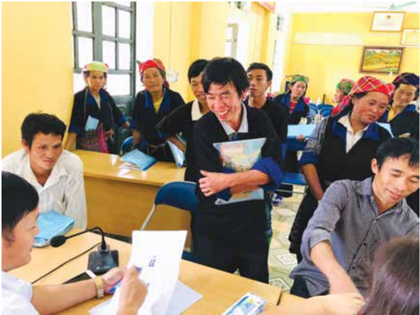
Người nhận tiền dịch vụ môi trường rừng ở Mù Cang Chải, tỉnh Yên Bái tìm hiểu về mở tài khoản ngân hàng