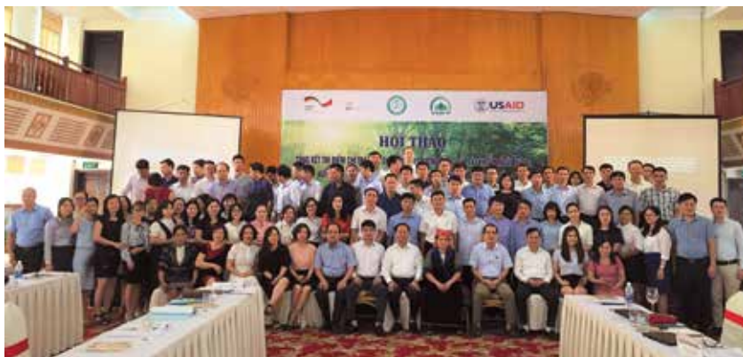
Hội thảo tổng kết thi điểm trả tiền DVMTR qua tài khoản ngân hàng