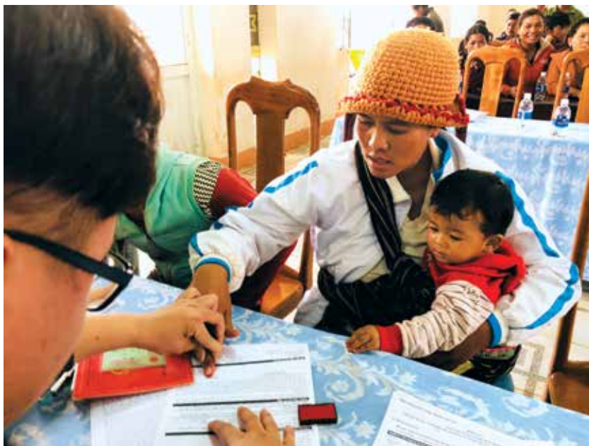
Đại diện hộ gia đình tại Đắc Nông hoàn thiện thủ tục mở TKNH

2.4. Quỹ BV&PTR cấp tỉnh gửi danh sách sơ bộ mở TKNH nhận tiền DVMTR của bên cung ứng DVMTR tới ngân hàng được ủy thác thực hiện dịch vụ trả tiền DVMTR qua TKNH.