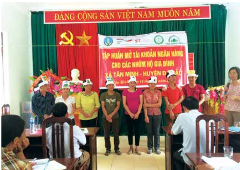
Bà con tham gia các trò chơi để tìm hiểu về trả DVMTR qua TKNH.